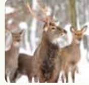
Cerf de Virginie