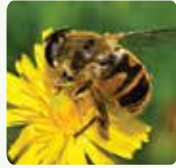
Installation de ruches