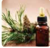
Produits manufacturés et matériaux